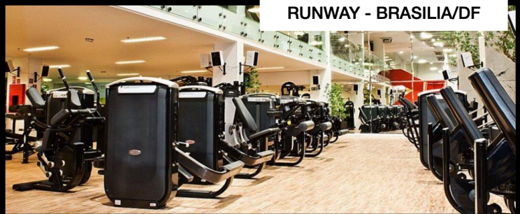
RUNWAY - BRASILIA/DF